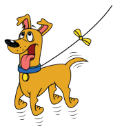
kiképzés alatt áll