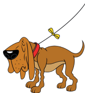
idős és morcos